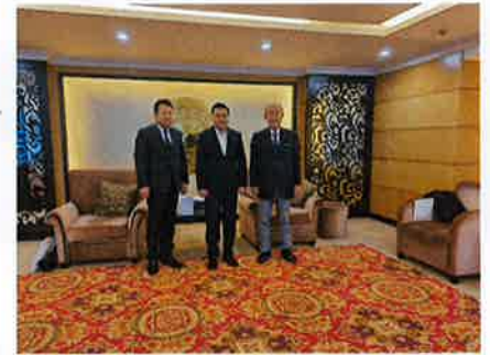
送出国営企業の会長との面談 ①

N企業とは、政府機関のベトナム科学アカデミー省の唯一の国営企業です。技術、投資、貿易サービスの3つの分野で事業の発展を構築している企業である。約50の企業などの管理、運営を行っている管理会社として展開し、その中に人材派遣、自動車学校、日本語学校がある。