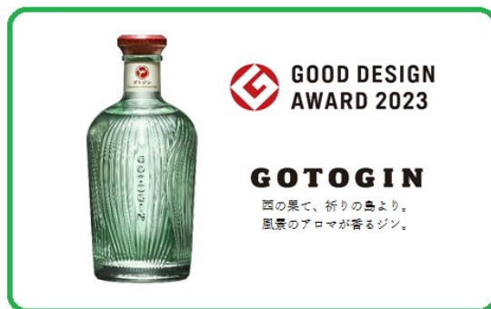
独特の容器に入ったクラフトジン「GOTOGIN」

長崎港から西に約100kmの位置にある五島列島の福江島で生産するクラフトジン「GOTOGIN」を日本中に味わってもらいたい、そしてやがては、ジンの市場規模が1兆2000億円と言われるヨーロッパ市場へ参入し、特に本場イギリスへ進出したい。キンビールを退社した3名で2022年(令和4年)12月に開業した五島つばき蒸溜所で生産する、慈(いつくし)の島、五島のロマンが詰まった世界に誇るクラフトジン「GOTOGIN」についてご紹介。