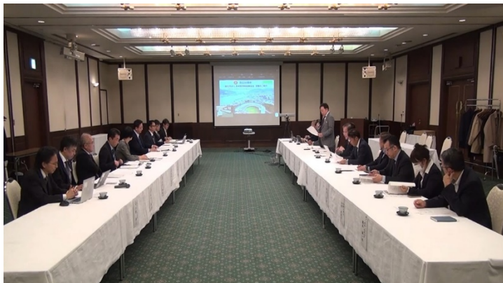
長崎県と情報産業協会との意見交換会 (於：ホテルセントヒル長崎)

※会場(22名)と、オンライン参加(12名)を合わせて、34名(内、県側11名)が参加