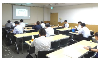
第4回理事会(於:アルカス佐世保)