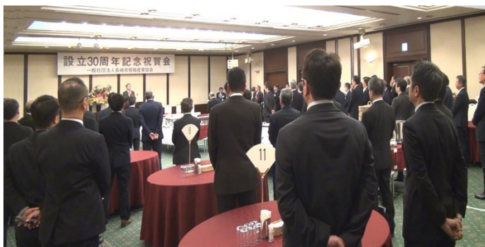
ご来賓代表のご祝辞