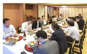
ビジネスコラボ会(於:いけ洲博多屋)