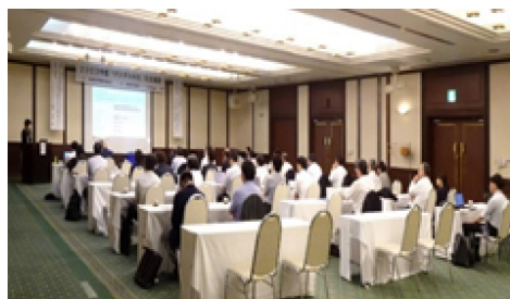
【会場】ホテルセントヒル長崎「妙見の間」

2021(令和3)年9月1日にデジタル庁が発足したことを記念して、10月の第1週をデジタルの日として定め、全国各地で記念イベントが開催されています。2022(令和4)年度は、福岡県サービス産業協会(FISA)と共催し、福岡市で10月3日(月)に開催しましたが、2023(令和5)年度は、NISAが主催し、FISAと共催して、長崎市内の「ホテルセントヒル長崎」において、オンライン併用方式で開催しました。参加者86名(会場出席者36名、WEB出席者50名)