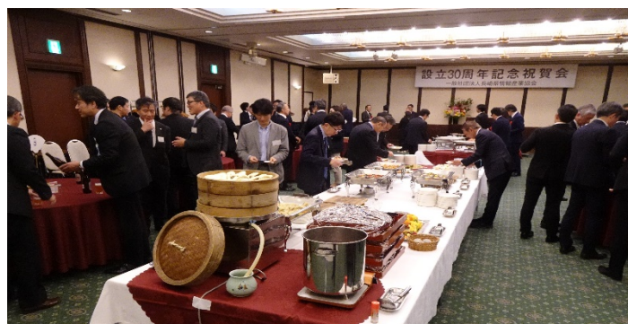
記念祝賀会 (懇親・懇談)