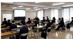
佐世保市 研修会場