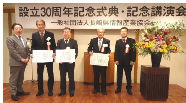
協会表彰 感謝状授与式