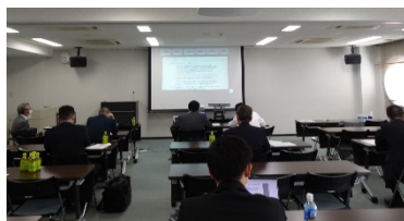
第1回 理事会 「出島交流会館」