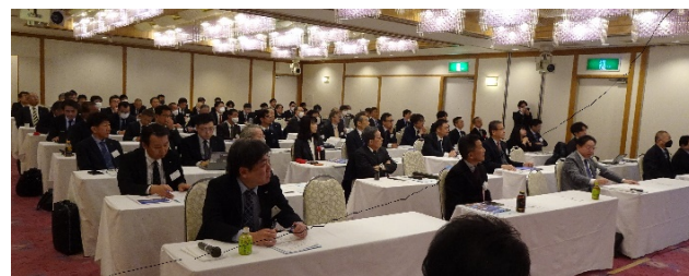
式典会場 ホテルセントヒル長崎 (紫陽花の間)