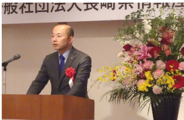
長崎市長 鈴木 史朗様