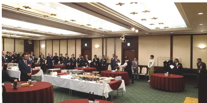
記念祝賀会 ご来賓のご紹介