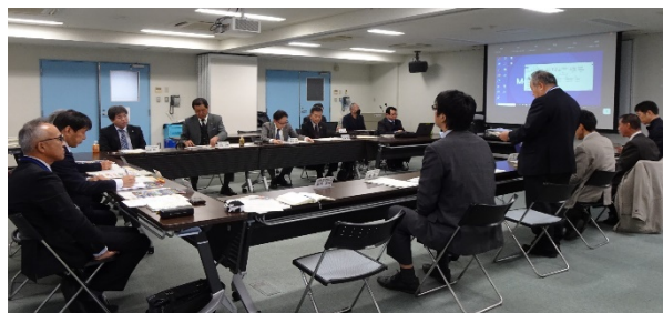
工業技術センター様との意見交換会（出島交流会館）