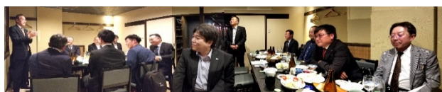
ビジネスコラボ会 「梅屋」