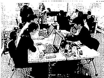
新入社員研修風景