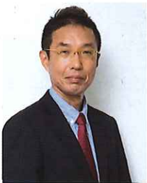
日本電気株式会社 サイバーセキュリティ 戦略本部 本部長

それができる社員となってもらおうツールの一つとして、情報処理安全確保支援士制度を活用しています。