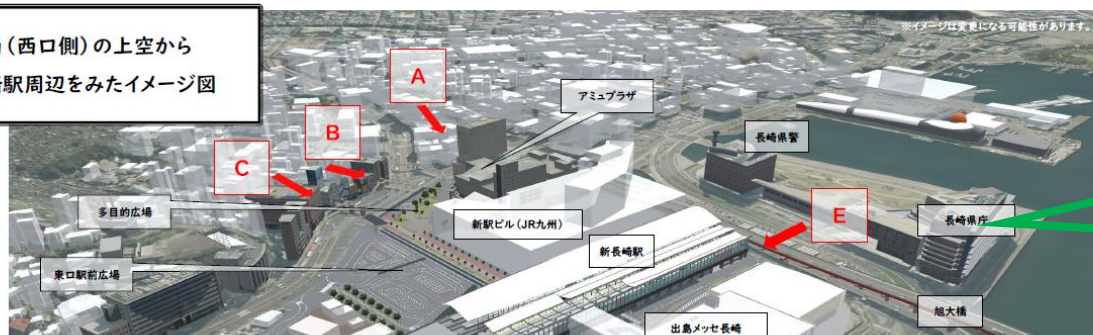
北西(西口側)の上空から 長崎駅周辺をみたイメージ図