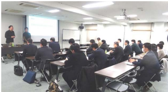
AWS (Amazon Web Services) セミナー 2019年(H31年)2月15日(金) 於: 出島交流会館 9F

アマゾンウェブサービスジャパン(株)より大阪と福岡より2名の講師をお招きして、2006年サービス開始、2011年東京リージョンサービス開始以来、多くのユーザーと長年の運用実績を有するAWSクラウドについてセミナーを開催しました。