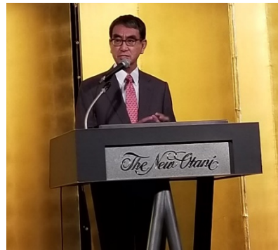
デジタル大臣 河野 太郎氏

今年は、政府 関係省庁より大臣(副大臣)をお招きして東京で「新春交歓会」が開催されました。NISA会員へ参加募集し、今年は3名が参加しました。ANIAの活動として、政府に対するIT業界からの意見提言などを実施しています。今年は、右記の方々が登壇され、懇親会で名刺交換、意見交換を行いました。