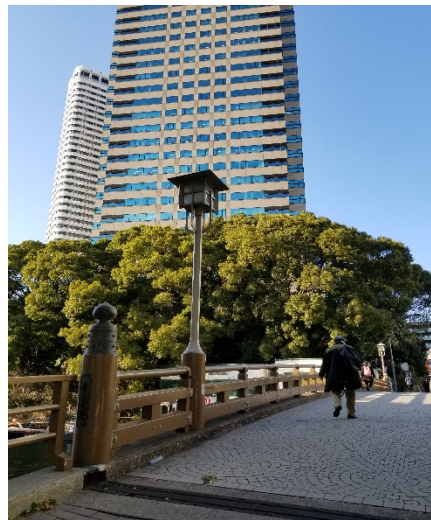
ホテルニューオータニ東京