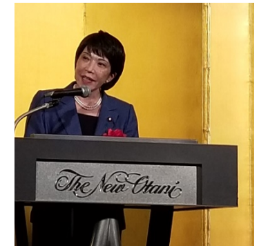
経済安全保障担当大臣 内閣府特命担当大臣 高市 早苗氏