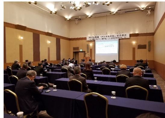
講演会会場 [西鉄グランドホテル2F プレジールB ]

◆デジタル技術が飛躍的な進歩を続けている今日、我々の暮らしに無くてはならないパートナーである自動車は、今後、どのように進化して行くのか、我々にどんな驚きと感動を与えてくれるのか、講演会では、デジタル技術が変えていく自動車の未来について、ご講演を戴きました。