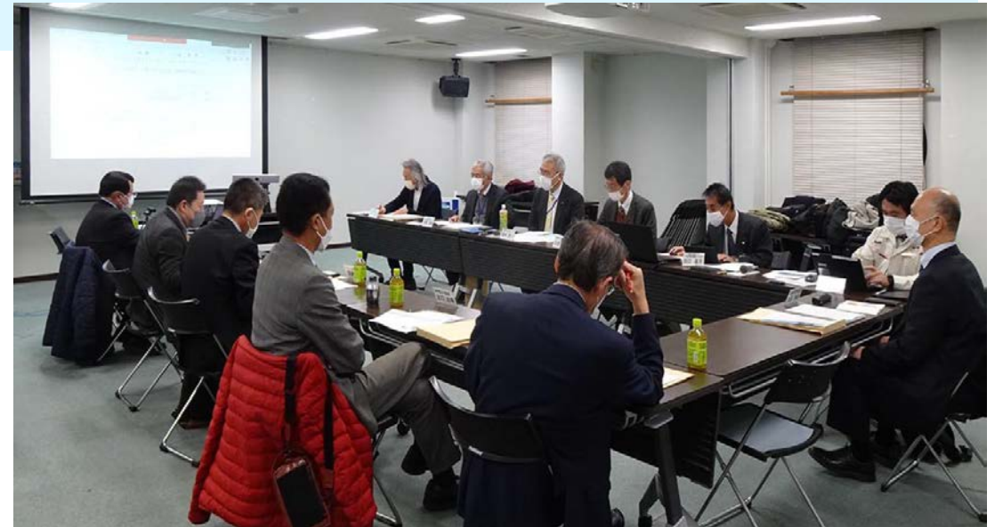
長崎県工業技術センターとの意見交換会 (於：出島交流会館)