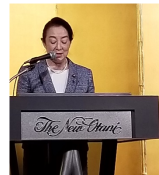
総務副大臣 尾身 朝子氏