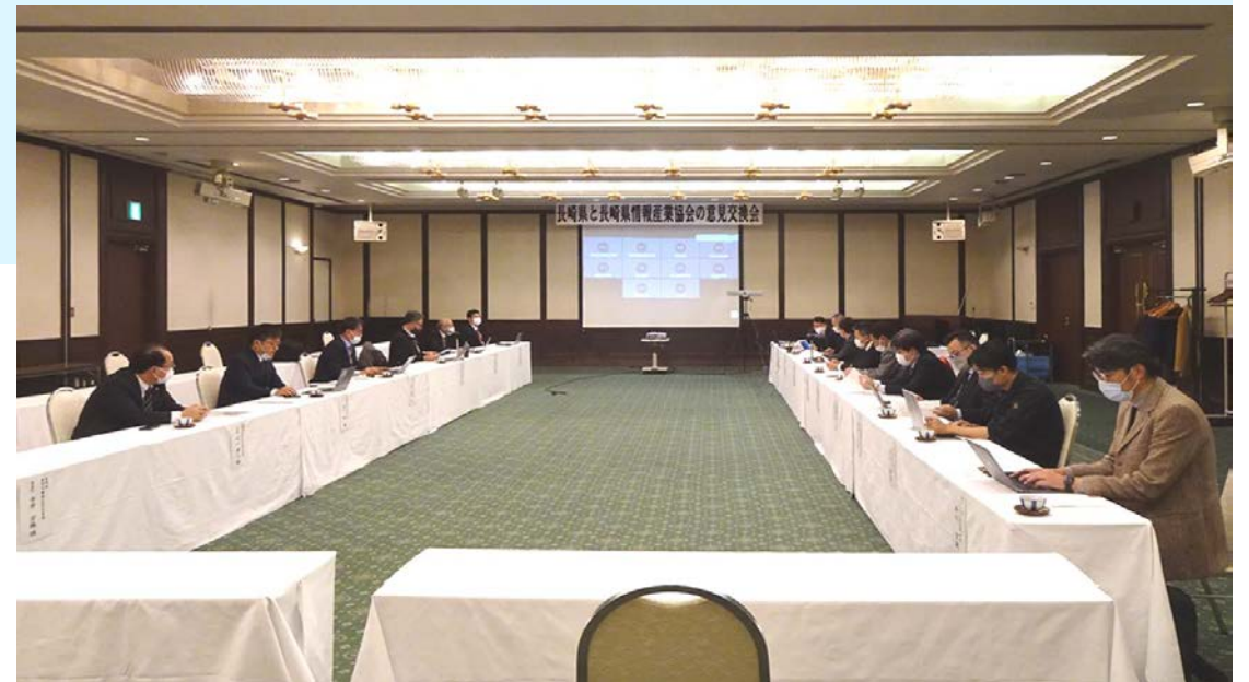
長崎県と情報産業協会との意見交換会 (於：ホテルセントヒル長崎)