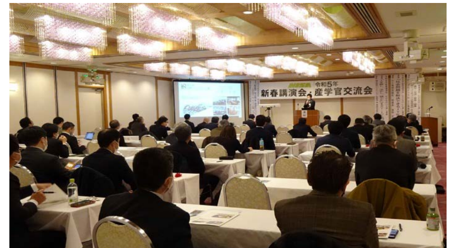
新春講演会 ホテルセントヒル長崎 3階 紫陽花の間