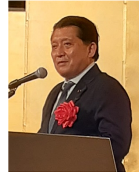
初代デジタル大臣 平井 卓也氏