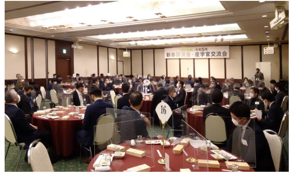
産学官交流会会場（ホテルセントヒル長崎2階 妙見の間）

2023年1月26日（木）長崎市内「ホテルセントヒル長崎」（長崎市筑後町4番10号）に於いて「令和5年 新春講演会」、及び「産学官交流会」を開催しました。「新春講演会」には、長崎県、長崎市の関係者、及び、大学、団体、当協会会員、一般参加を含め、会場参加76名、WEB参加32名の合計108名様にご参加を戴きました。また、18時からの「産学官交流会（懇親会）」は、新型コロナウイルス感染対策を考慮して、アクリル板のセパレートを付けた円卓に着座して飲食する会席方式として、会場参加にて開催しました。「交流会」には、長崎県、長崎市の関係者、及び、長崎大学、長崎総合科学大学、関連団体、当協会会員などを含め、77名様にご参加戴きました。