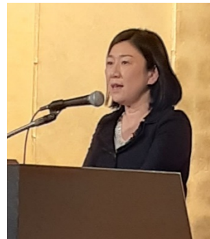
前デジタル大臣 デジタル社会推進本部 幹事長 牧島 かれん氏