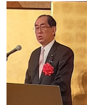
総務大臣 松本 剛明氏