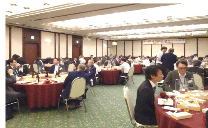
産学官交流会(懇親会) ホテルセントヒル長崎 2階「妙見の間」