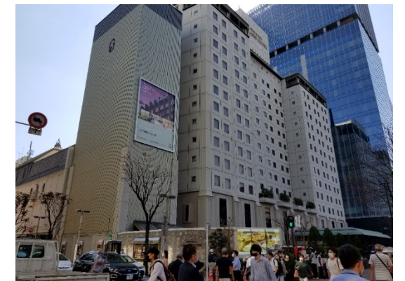
西鉄グランドホテル (福岡県中央区大名2-6-60)