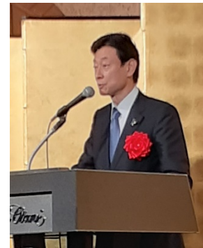
経済産業大臣 西村 康稔氏