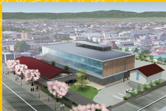
「スマートシティ AiCT (ICTオフィス)」